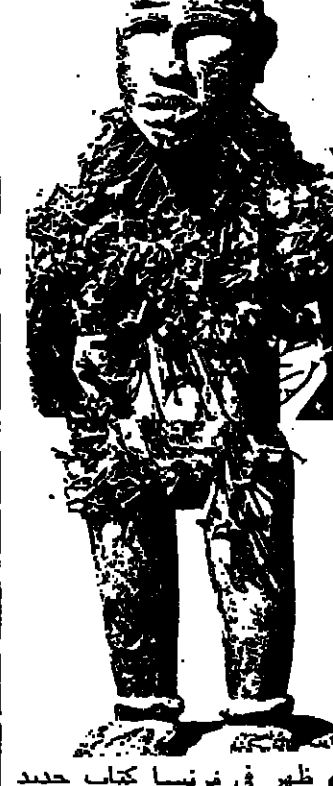
الفن الصيني الحديث

عنوان «الفن الصيني الحديث» ظهر في فرنسا كتاب جديد بعنوان «الفن الصيني الحديث» وتاليف «موريه كلود» ويحاول الكتاب ان يلقى بعض الضوء على الحركة الفنية التشكيلية الحديثة في الصين الشعبية ، من خلال تحليل لبعض الاعمال الهامة . وارتباطها بالثورات الفنية السابق .